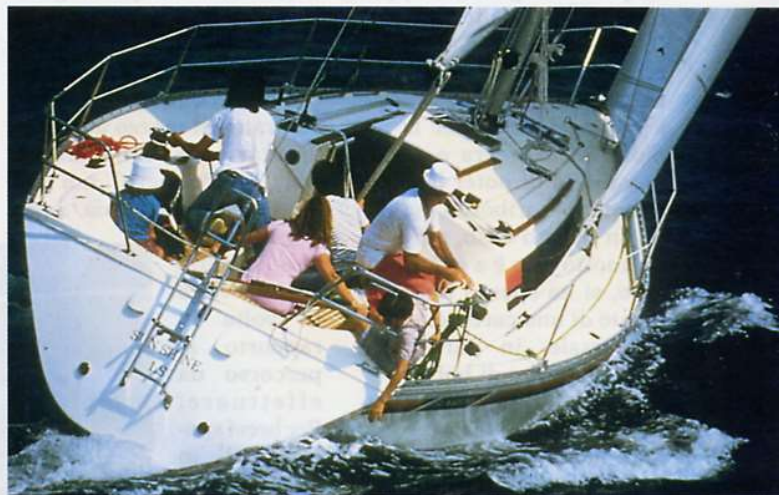
Il Sun Shine 38 in navigazione e a destra particolari degli interni dell'ultima versione che presentava allestimenti più raffinati.

Si è svolta con le consuete condizioni perturbate cui questo inverno ci ha abituati: onda vecchia da scirocco e vento incostante con punte di 25 nodi e repentine cadute in calme fer-